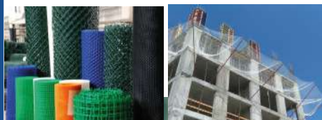
СЕТКА ФАСАДНАЯ; ЗАЩИТНО-УЛАВЛИВАЮЩАЯ СЕТКА