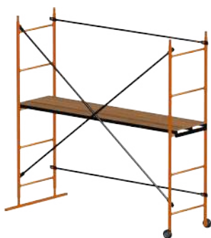
ПОМОСТЫ КОМПАКТНЫЕ до 2 м высотой