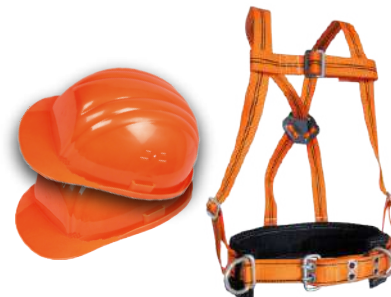
КАСКИ МОНТАЖНЫЕ ПОЯСА В НАЛИЧИИ