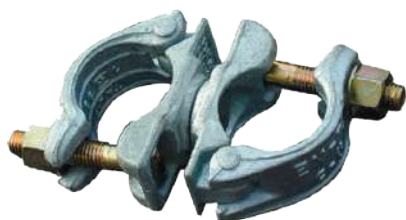
ХОМУТЫ КОВАННЫЕ ОЦИНКОВАННЫЕ