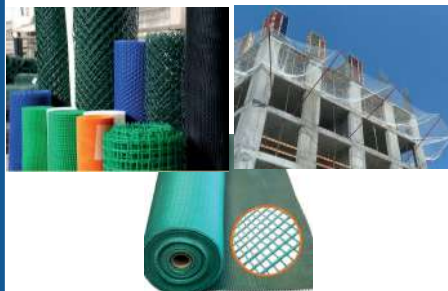
СЕТКА ФАСАДНАЯ; ЗАЩИТНО-УЛАВЛИВАЮЩАЯ СЕТКА