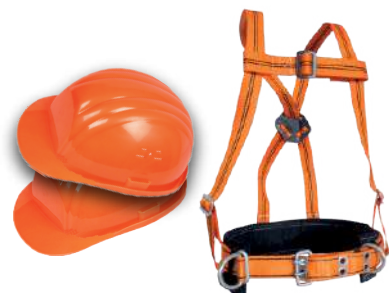
КАСКИ МОНТАЖНЫЕ ПОЯСА В НАЛИЧИИ