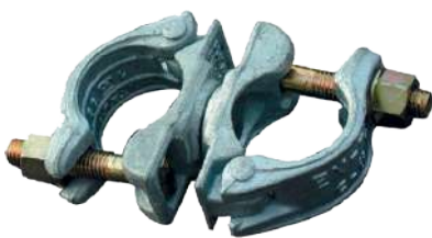
ХОМУТЫ КОВАННЫЕ ОЦИНКОВАННЫЕ