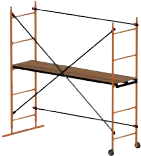
ПОМОСТЫ КОМПАКТНЫЕ до 2 м высотой